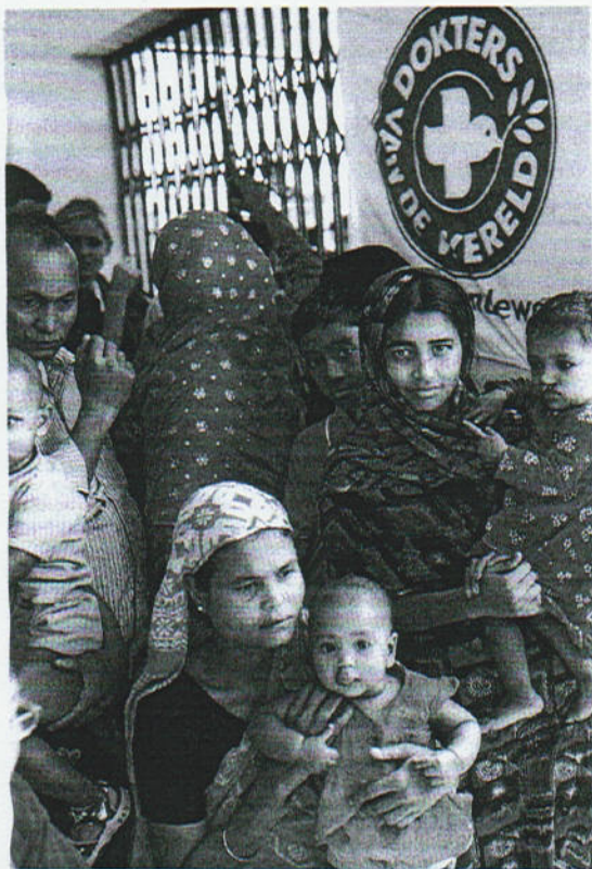
Enkele patiënten in Bangladesh.