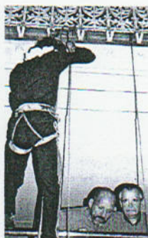
De Blue Brothers hebben hoogtevrees.