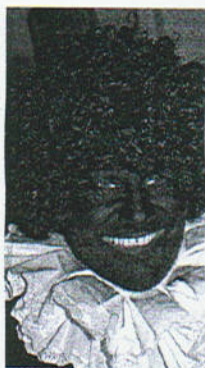
Zwarte Piet maakt er een feestje van.