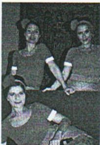
De Biff's zingen voor Sinterklaas en bieden later op de avond ruimte tot biechten.